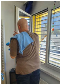
Herr O. beim Jahresputz

«Die Wohnbegleitung ist zur wichtigen Stütze im Leben geworden.»