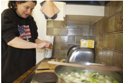
Frau E. beim Lernen einfacher Kochmenüs

«Durch die Wohnbegleitung kann ich selbständig Wohnen.»